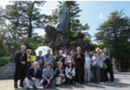
正隆会は宗祖御生誕800年を記念して、5月14日、御生誕の小湊、御修学の清澄山、そして茂原市大本山鷲山寺を参加者20余名にて参拝いたしました。（写真=旭ヶ森日蓮大聖人御尊像の前で）